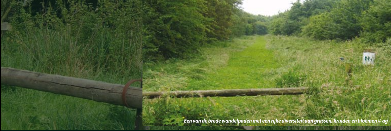
Een van de brede wandelpaden met een rijke diversiteit aan grassen, kruiden en bloemen