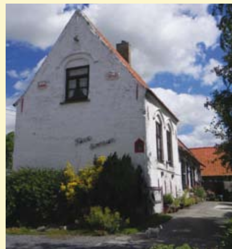
Onder de gerestaureerde Moorse Poort, rechts: hoeve Kleine Eversam, foto rechtsonder: site Ter Baecke

Er is regelmatig beweging, zoals we dat hier zeggen. Sinds de toeristische dienst van Alveringem thematische wandelingen organiseert, ontdekken steeds meer mensen het Eversambos. In de toekomst plant men een nieuwe fiets- en voetgangersbrug over de IJzer. Die zal het Eversambos doen aansluiten op het jaagpad langs de mooie IJzer. Zo zal een hoger gelegen pad, dat door de hooiweide van het bos zal lopen, aansluiten op het GR-pad én op het fietsnetwerk in de IJzervallei.